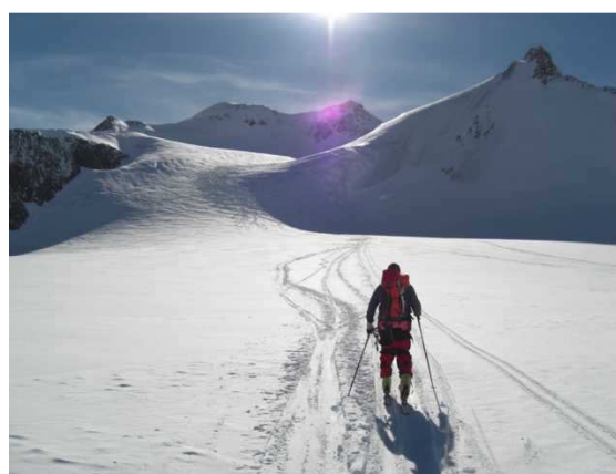
Die Wildspitze im Visier