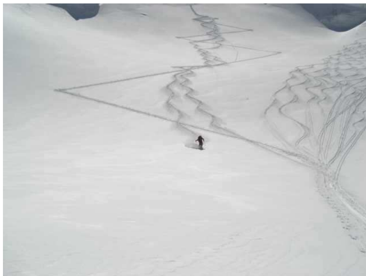
...und wir suchten schnell das Weite