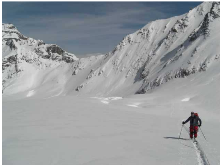
links hinten das Mittelbergjoch