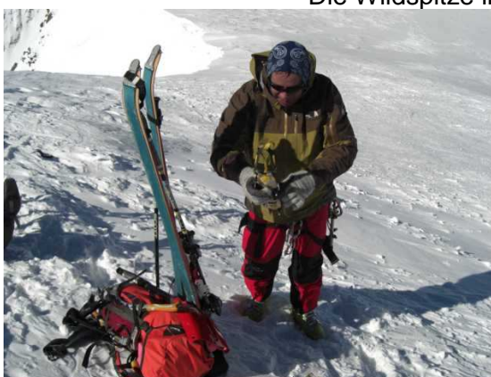
Schidepot unterm Gipfel