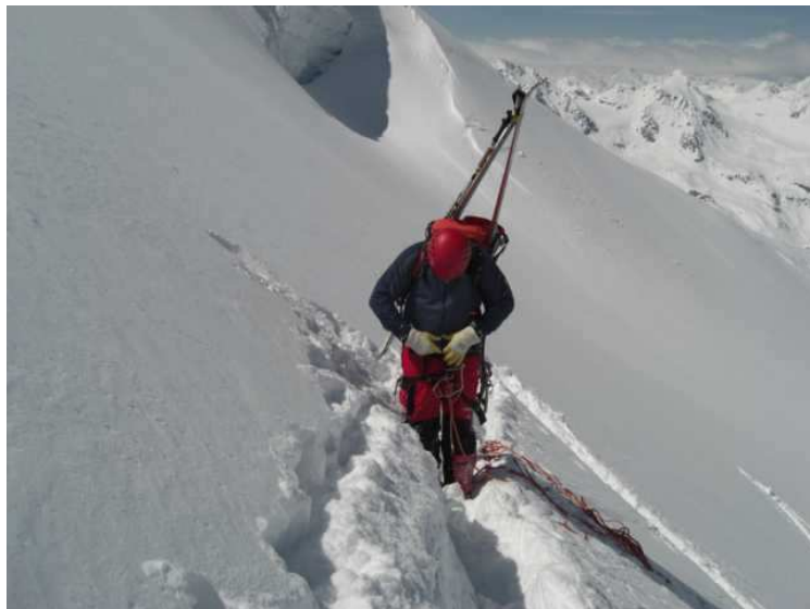
Am Einstieg bei sehr viel (zuviel) Schnee