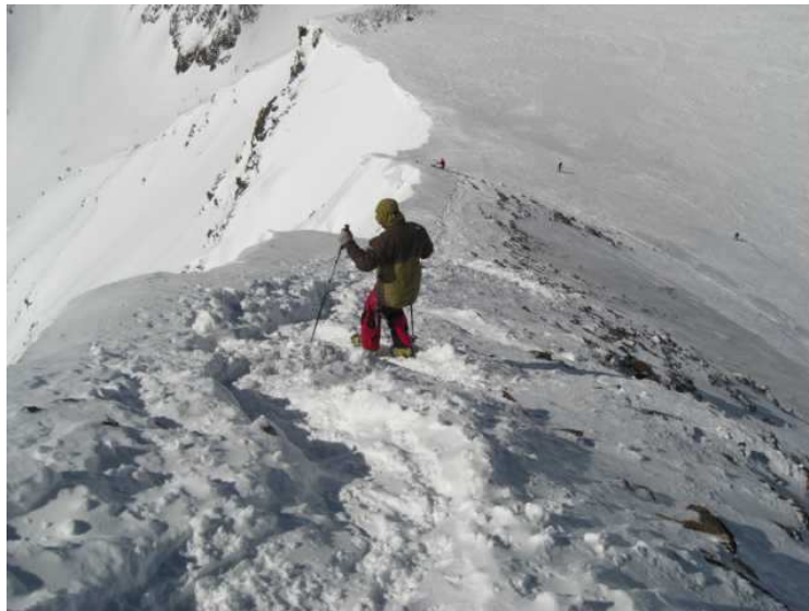
Abstieg zum Schidepot