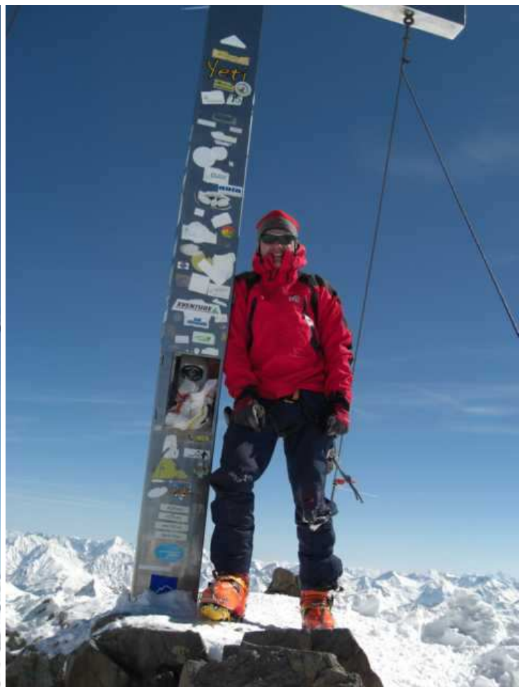
Immer wieder sehenswert: Das „Picklerkreuz“ der Wildspitze