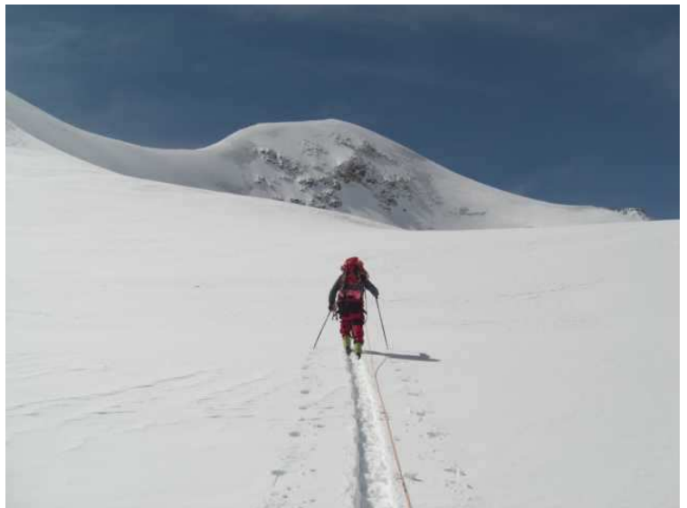
Erich bei der Spurarbeit Richtung Nordwand