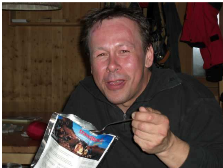
So lässt es sich leben. Sehr gute Stimmung im Winterraum des Taschachhauses