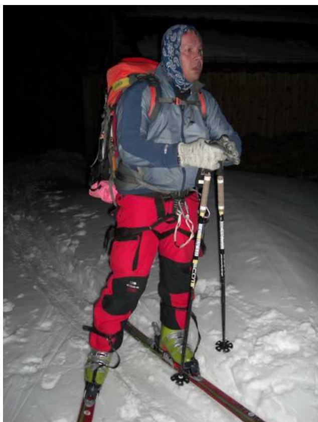
Aufbruch um 5:40