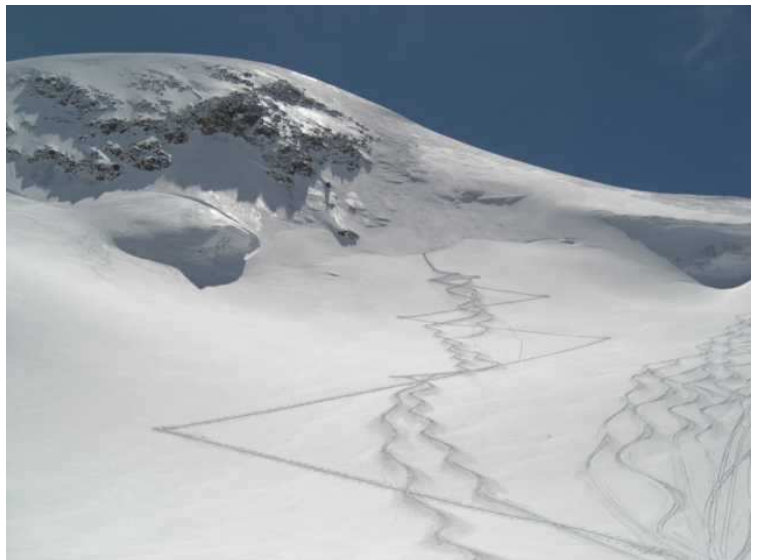
genau beim Bergschrund machte es „WUM“....