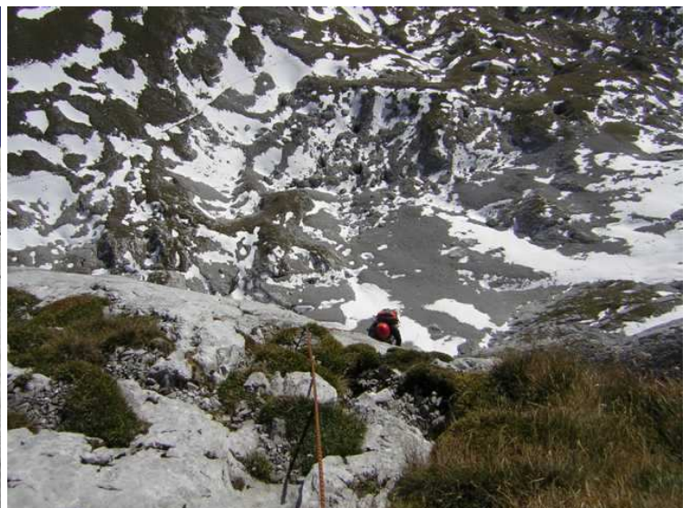
Tiefblick zum Trawiessattel mit den Schneefeldern