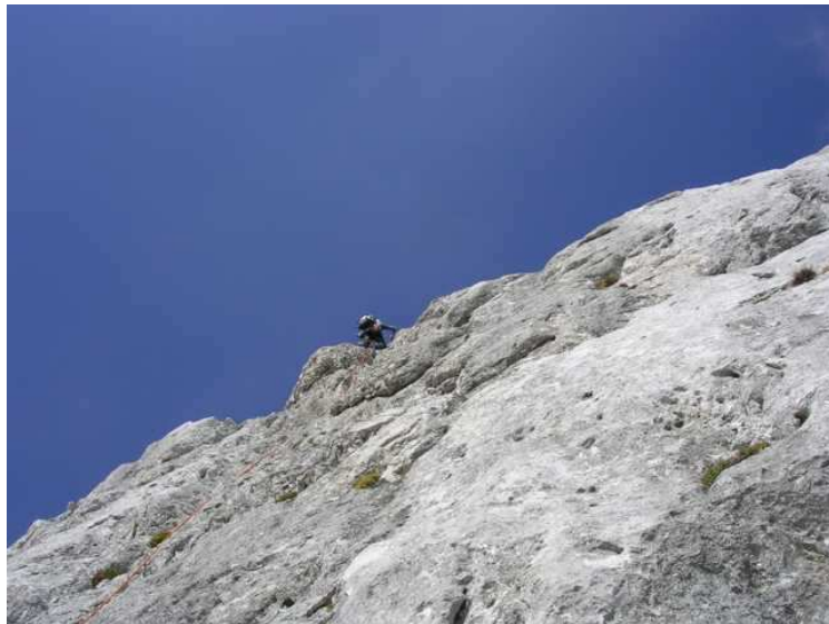
Schöne Wandstellen in Tourmitte