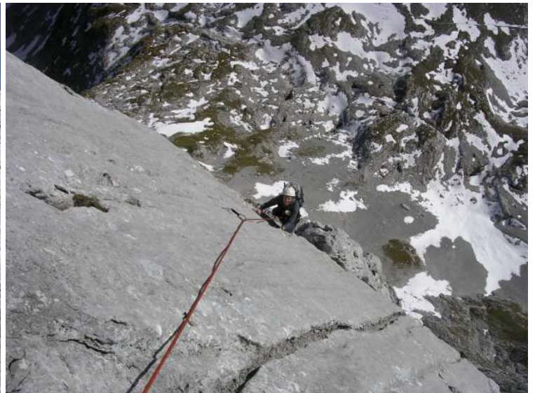
Ebsi in einer tollen Platte mit Wasserrillen