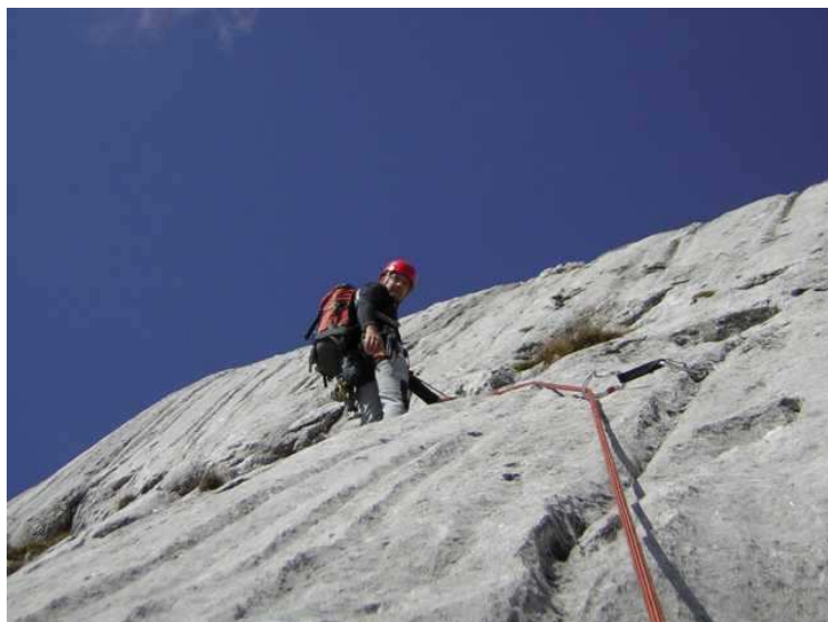
Sicht des Nachsteigers in der 8. SL