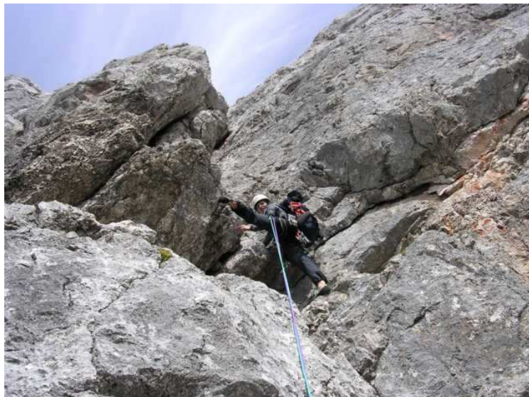
Und wieder eine schöne Verschneidung