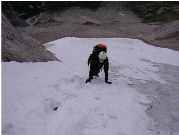
Das sehr harte Einstiegsfirnfeld (Steigeisen!!!)