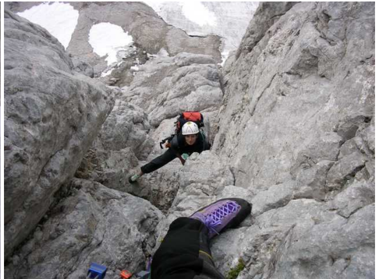
im ersten schönen Kamin