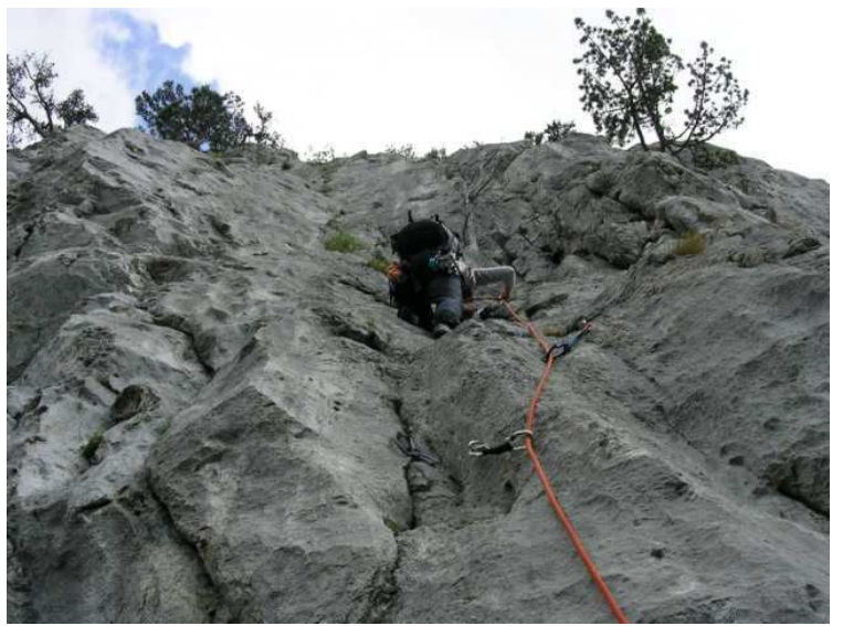
Ebsi in der Richter-Platte, V-