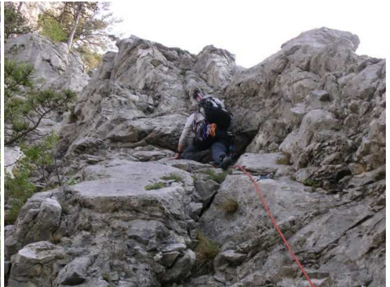
in der 2.SL, III+/VI-