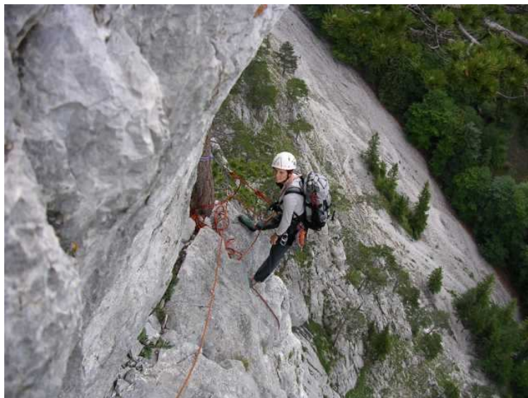
6.Stand nach der Platte