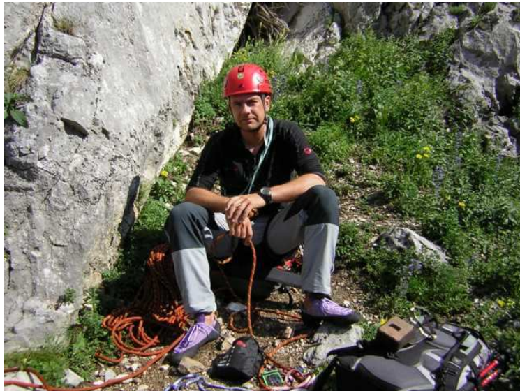
Am gemütlichen Anseilplatz