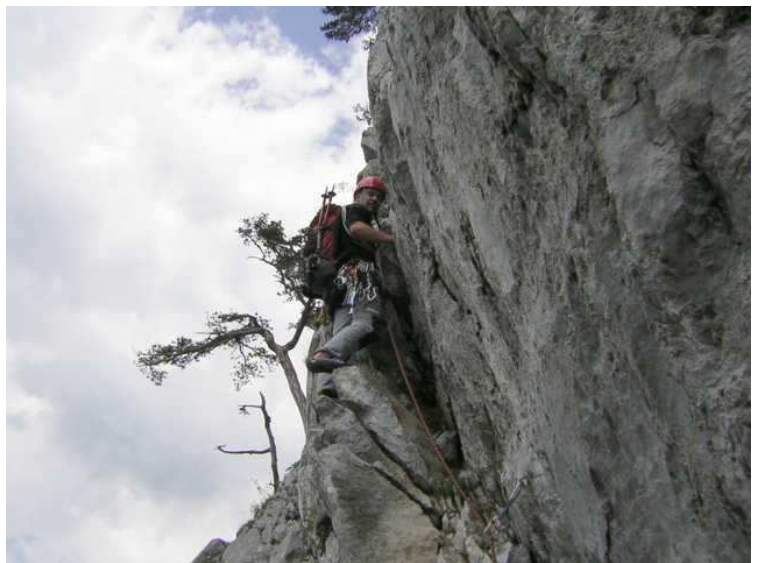
luftige Querung nach dem 6.Stand