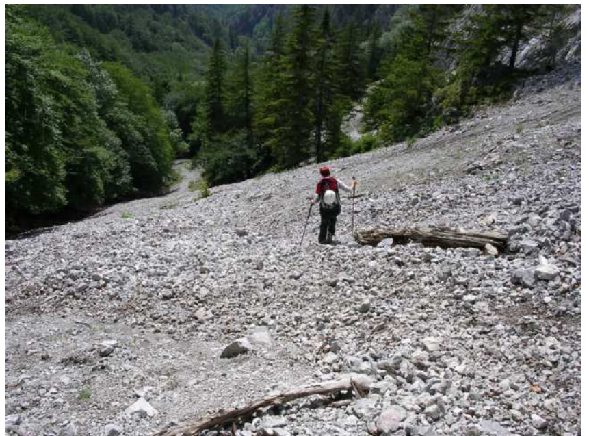
Ebsi im Abstieg