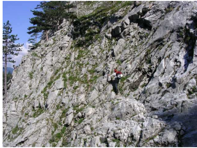
Ebsi im Zustieg zum Richterweg