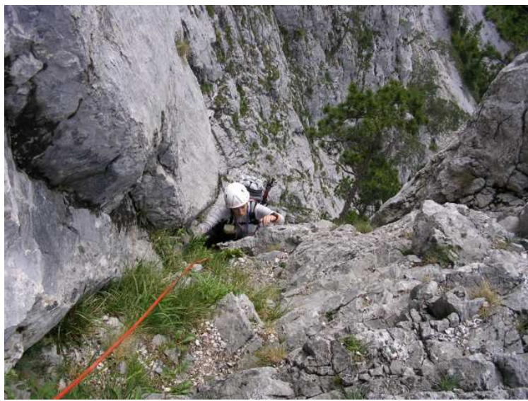
Kurz vor dem 4.Stand