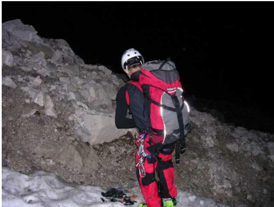
Wegen recht hoher Temp. Schon um 3:00 am Einstieg zur Rinne