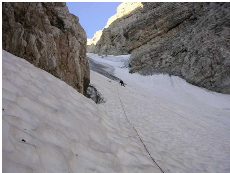
Der Firn war hart und gut zu steigen