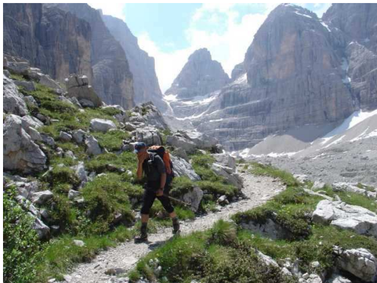
Nur noch wenige Minuten zum Rifugio Brentei