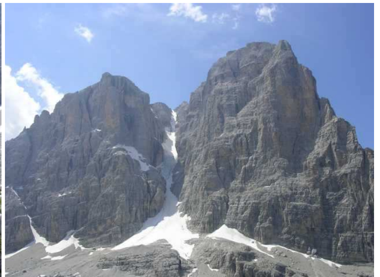
toller Blick in die Rinne beim Abstieg