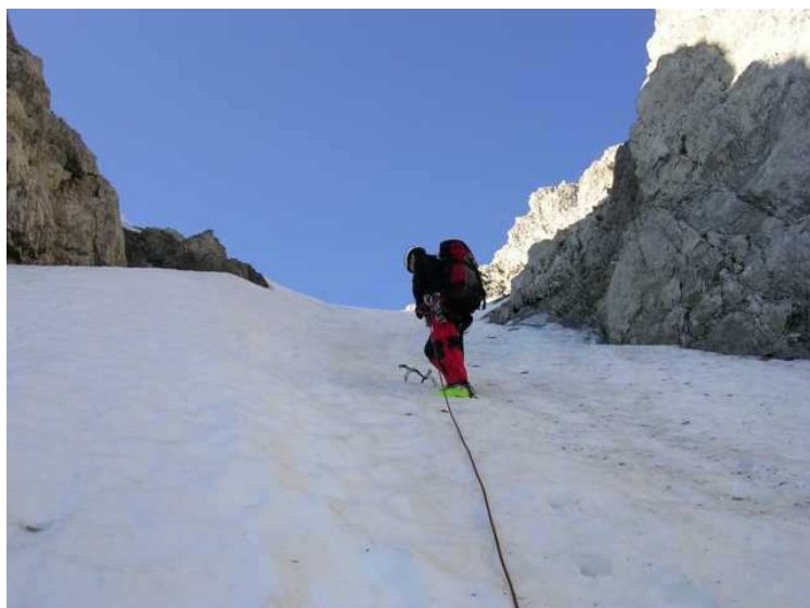
Nach dem Wulst scheint der Weg endlos