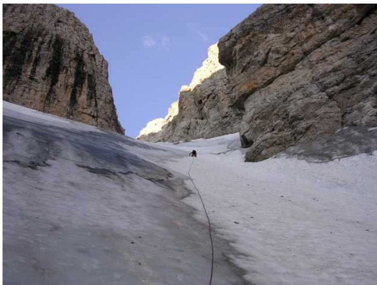
weiter oben wieder mehr Blankeis