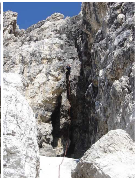
dann durch eine nasse Schlucht