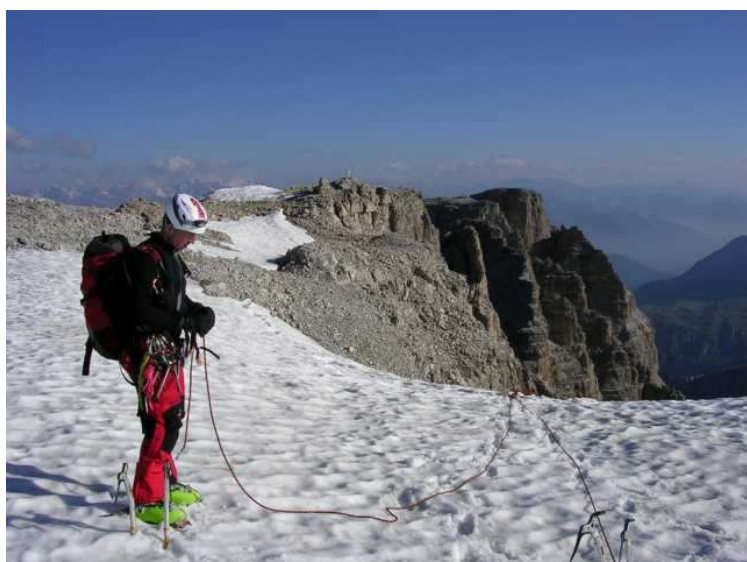
Es wird sehr schnell flach da oben..... ☺