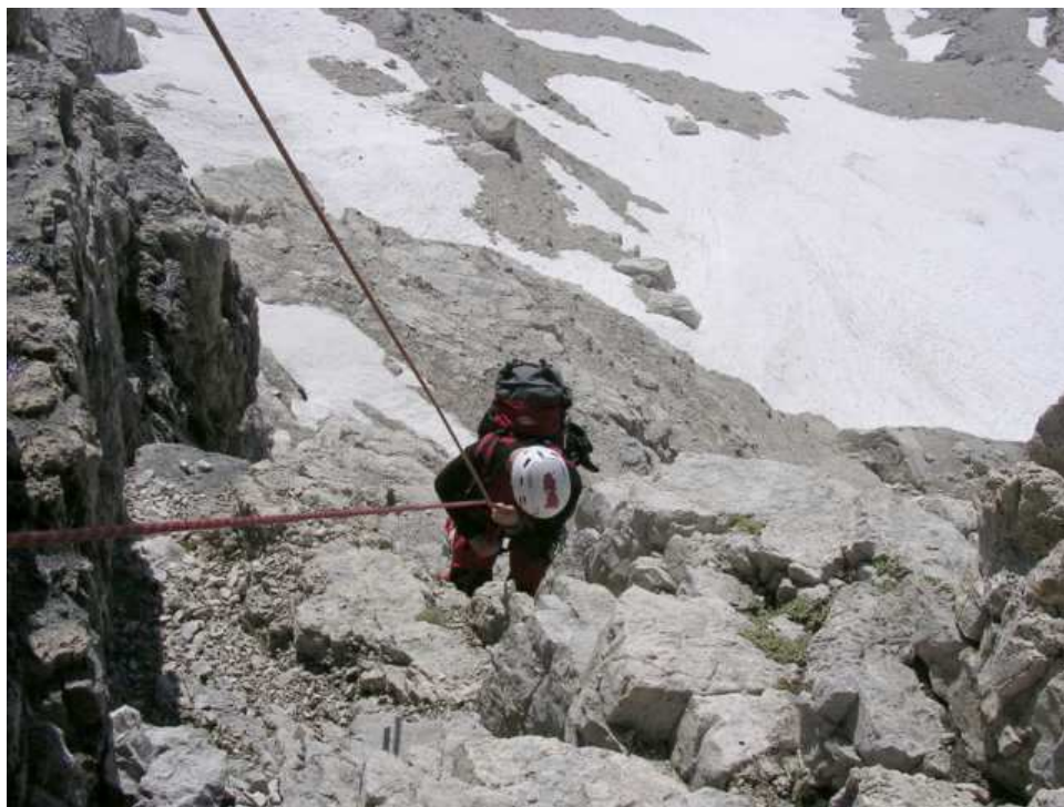
Zuerst über etwas schottriges Gelände abseilen.....