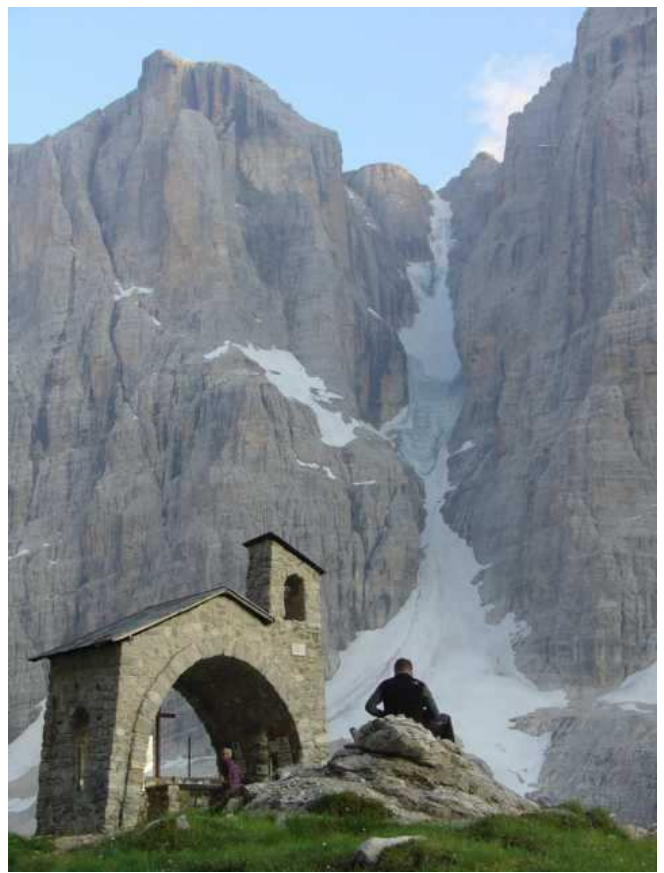
Bergidylle am Abend vor unserer Tour

Karte: Alpenvereinskarte Blatt 51, Info: Firn- und Eisklettern in den Ostalpen, Alpinverlag Jentzsch-Rabl