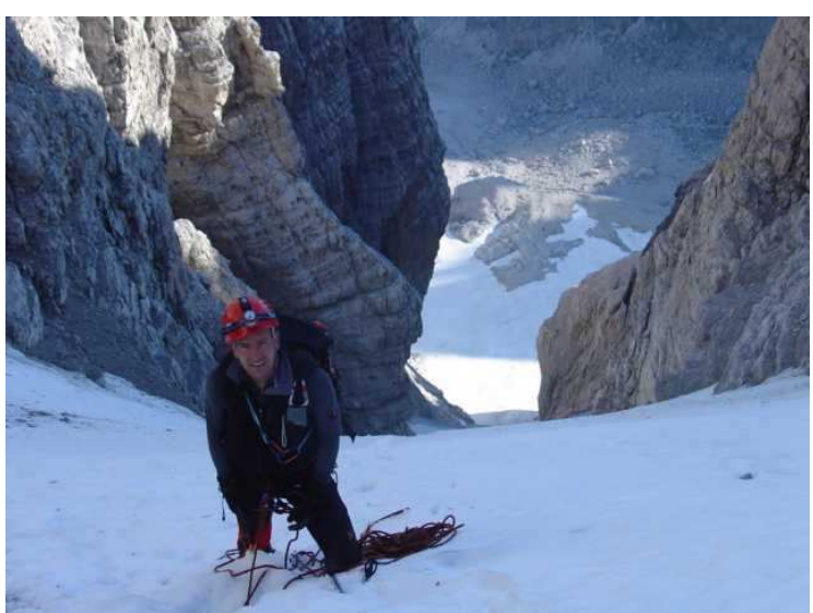
am letzten Stand, nur wenige Meter vor dem Ende