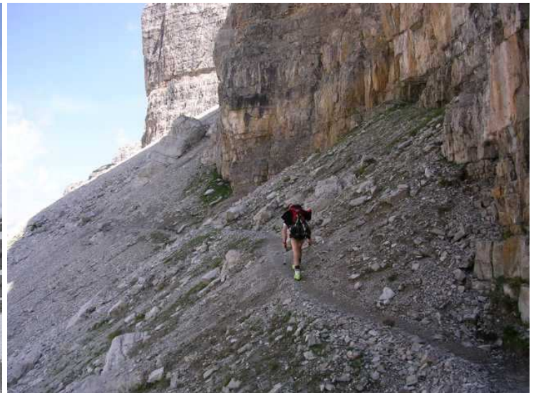
....aber auf seeehr schönen Wegen