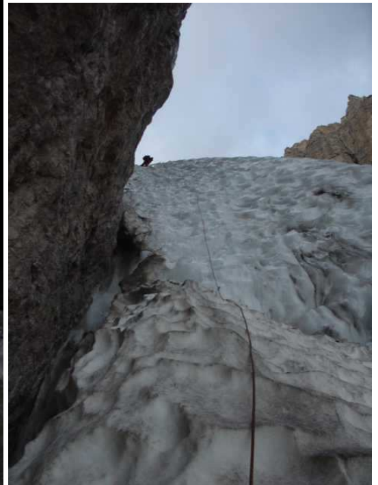
Wir erkletterten den Wulst ganz links