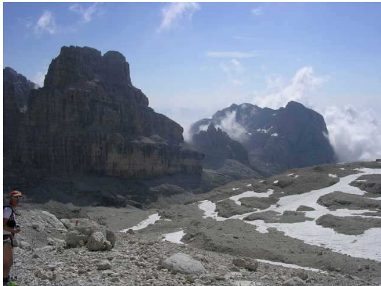
.....es folgt ein langer Hatsch