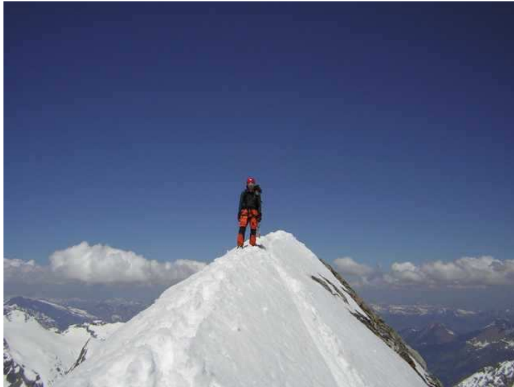
Direkt am Ausstieg