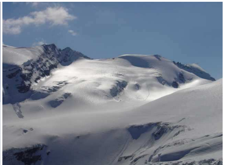
rechts die NW; ca. in Bildmitte der Abstiegsweg