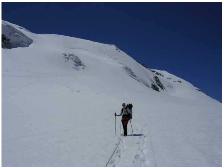
Im Abstieg vom Schneewinkelkopf