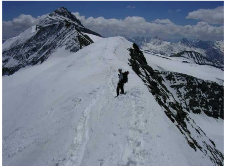
links im Hintergrund die Glocknerwand