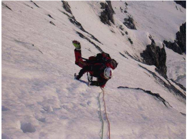
Nach der oberen Engstelle