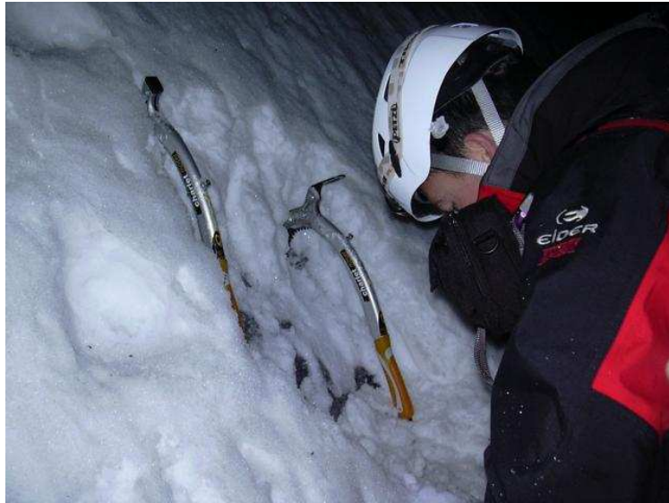
Das Blankeis wird sichtbar. Zeit zum Sichern.