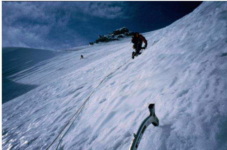
Tolle Perspektive im oberen Wandteil