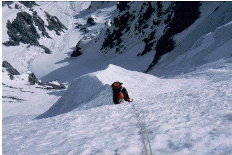
Kurz nach dem Serac