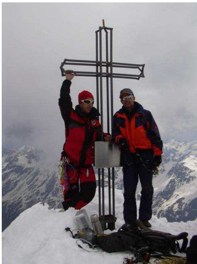
Nach der Durchsteigung der Nordwand am Ortler

Karte: Tabacco, 1:25000, Blatt 08, Info: Hochtouren Ostalpen, Bergverlag Rother