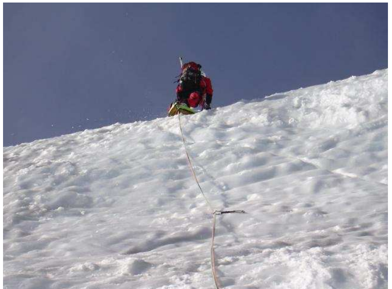
W alter im Vorstieg in dieser schweren SL