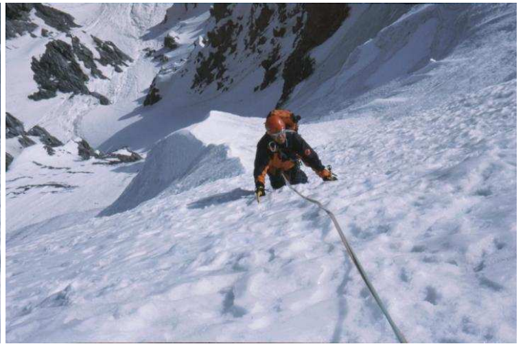
Atemberaubender Tiefblick zum Einstieg