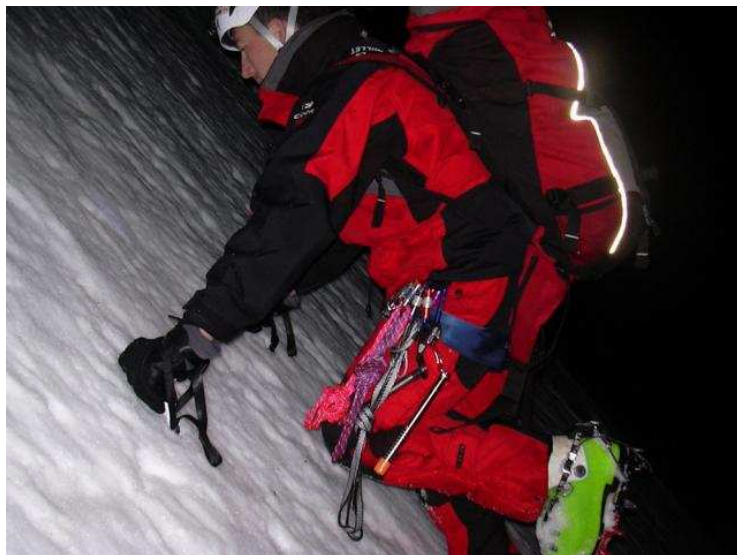
Zwischen 1. und 2. Engstelle. Seilfrei bei ca. 50°