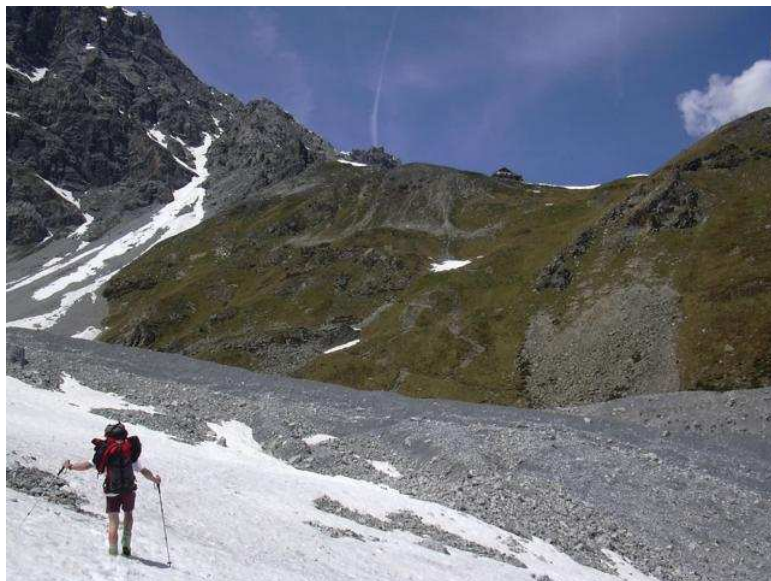
Beim Zustieg zur Tabarettahütte