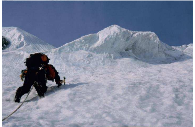
Sie wird immer größer.....