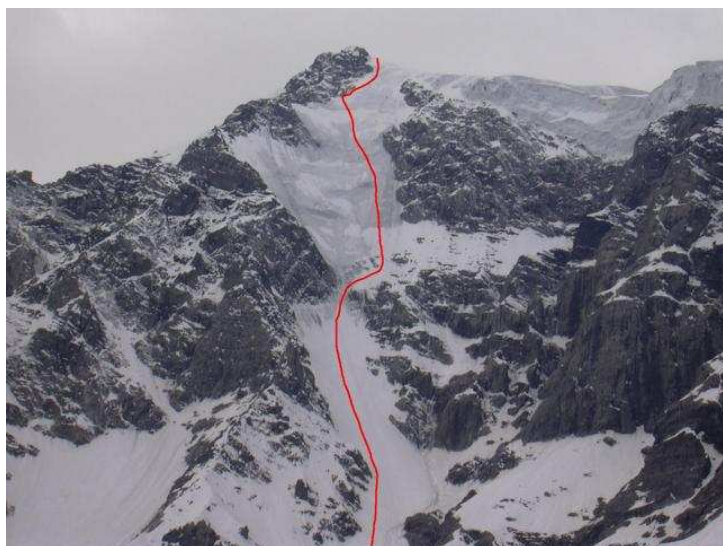
Unsere Linie durch die Wand