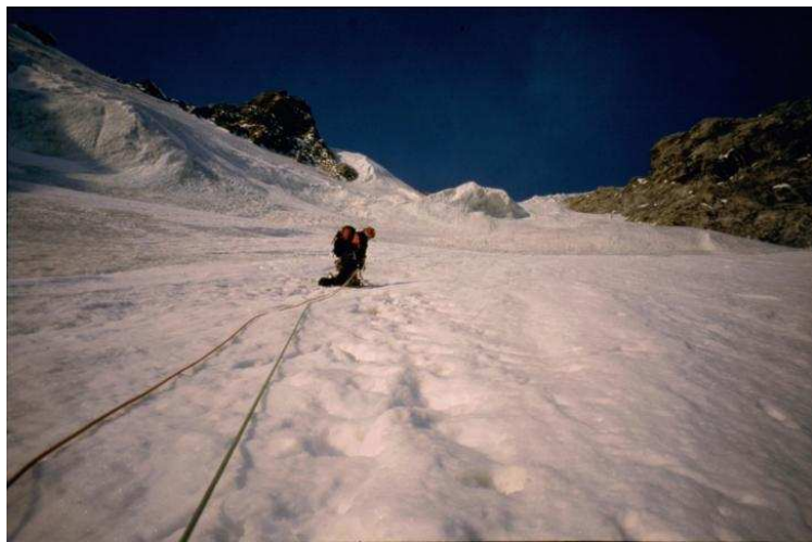
Unter der Eisnase (Serac) in der oberen Wandhälfte