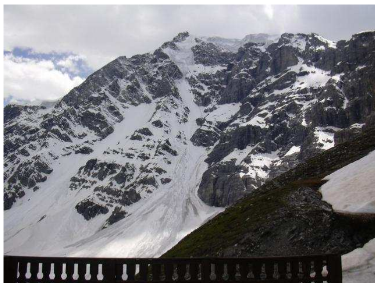
Die NW von der Hüttenterrasse