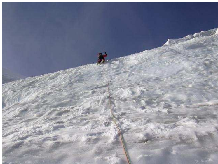
Neben dem Serac ist es sehr steil (ca. 80°)