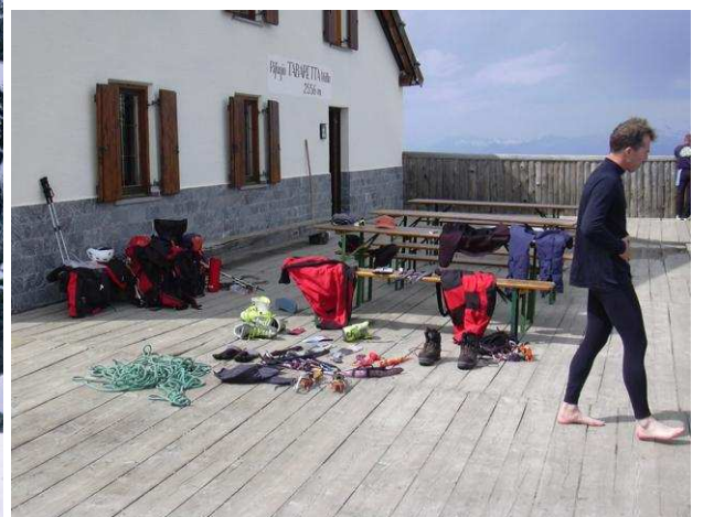
Zurück auf der Tabarettahütte