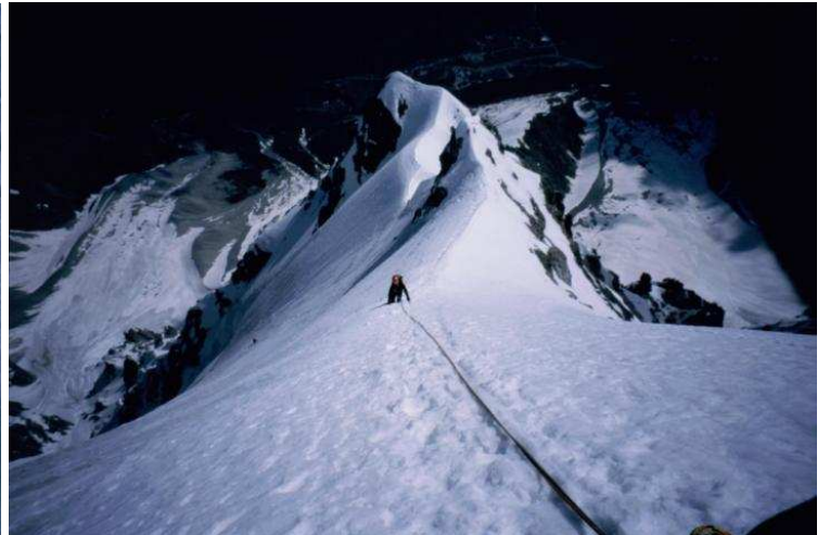
Der Marltgrat ist erreicht. Nur noch 3 SL