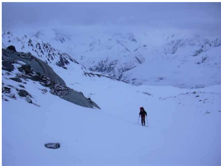
Evelyn am Mitterkarferner