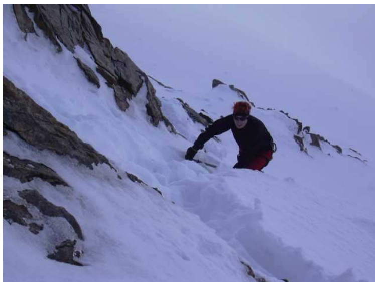
Die letzten Meter zum Gipfel