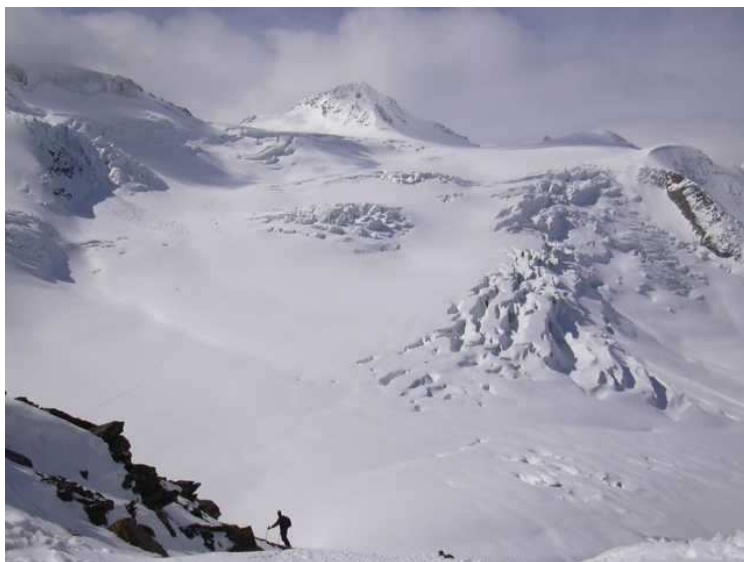
der Taschachferner (oberer Teil) im Überblick