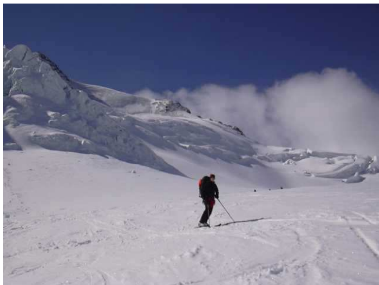
Abfahrt über den Taschachferner