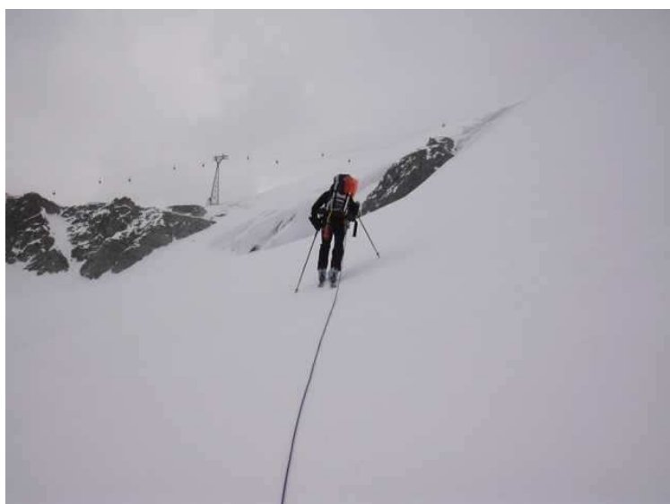
Querung am Hangender Ferner