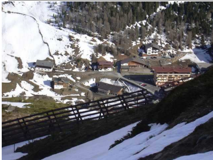
Vent bei schon recht wenig Schnee