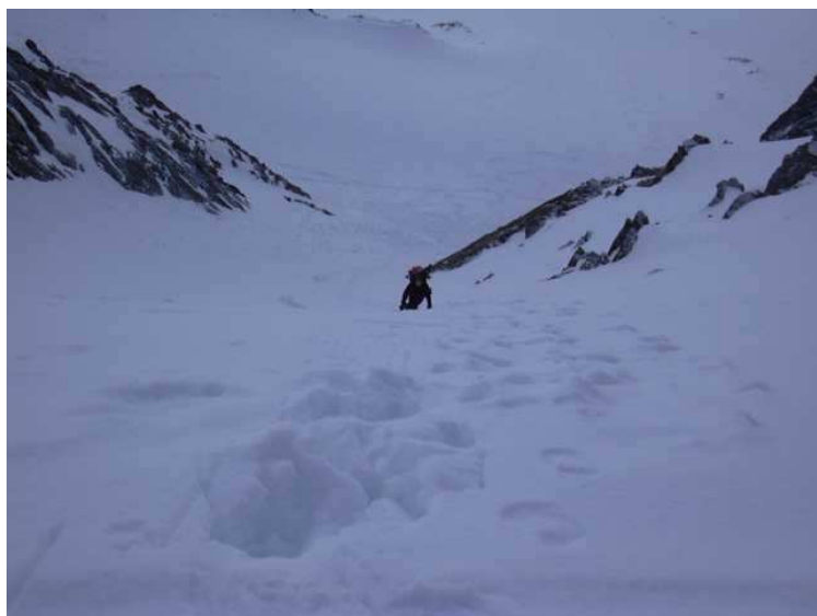
Im Aufstieg zum Mitterkarjoch