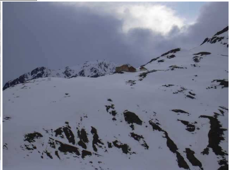
der letzte Hang zur Breslauer Hütte