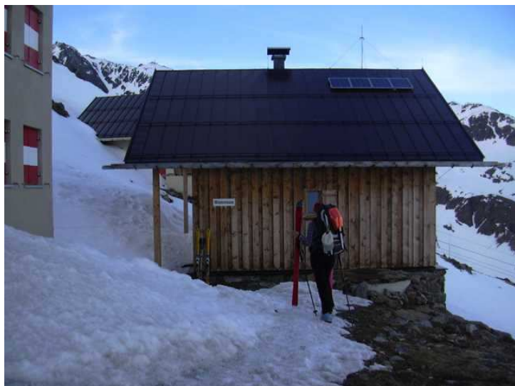
Winterraum der Breslauer Hütte