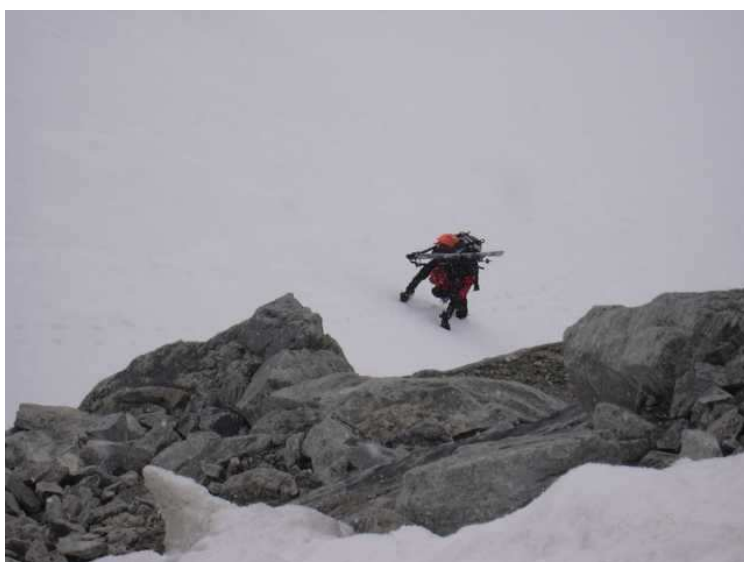
kurzes Steilstück hoch zum Rettenbachferner