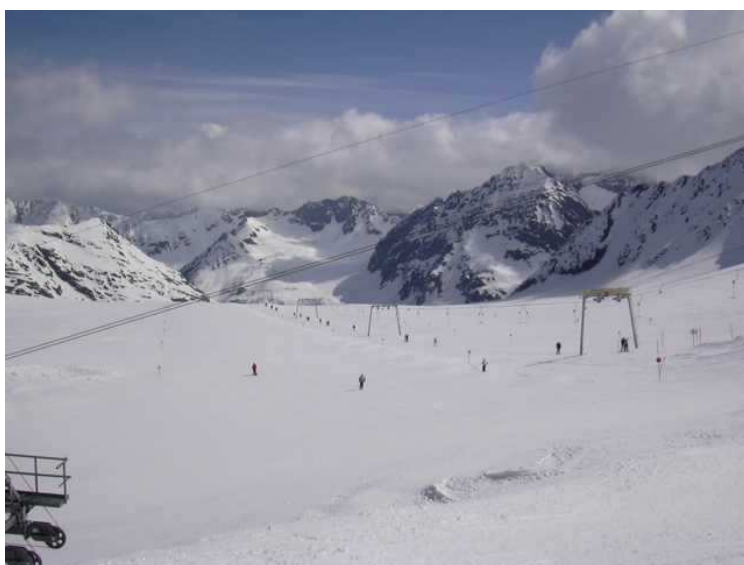
das Schigebiet am Mittelbergferner