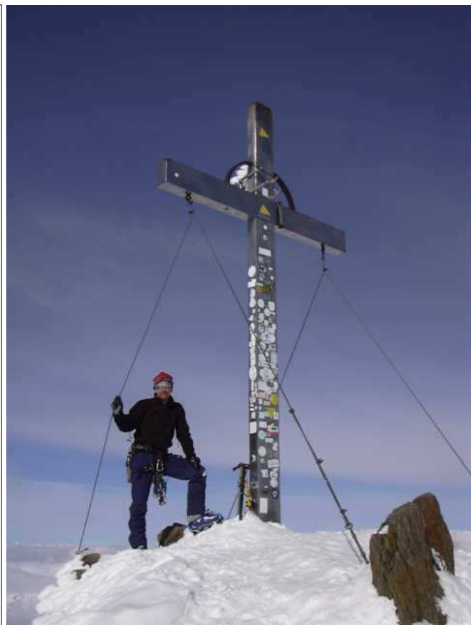
Am Gipfel der Wildspitze auf 3768m