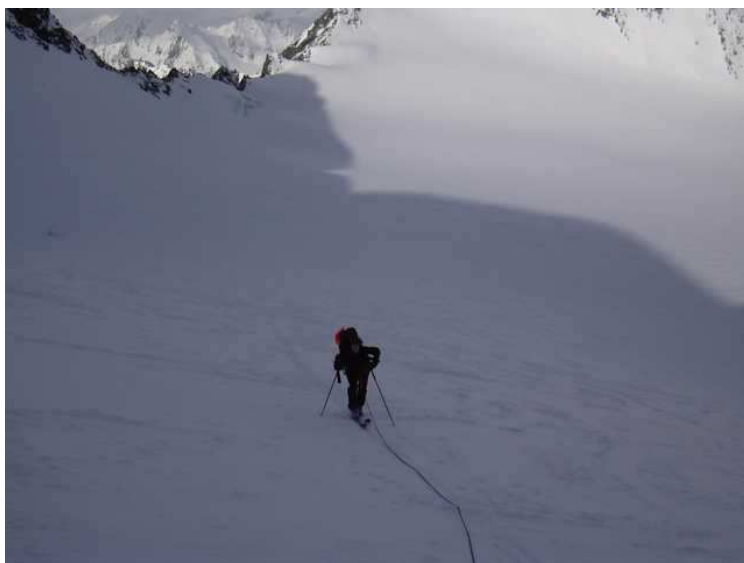
am Taschachferner; im Hintergrund das Mitterkarjoch