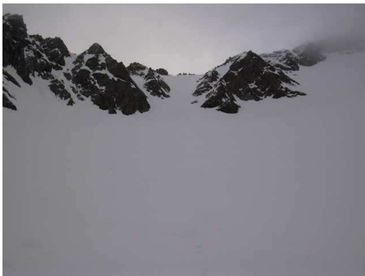
das Mitterkarjoch in Bildmitte