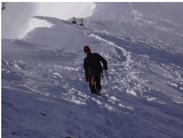
Abstieg zu unserm Schidepot