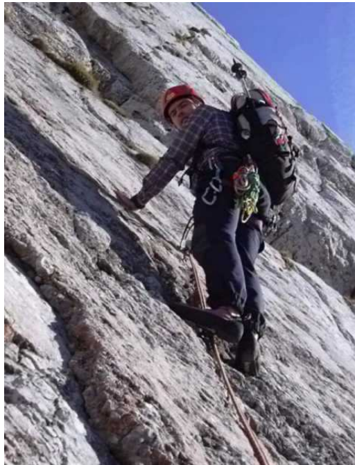
1.SL nach dem Plattenrand