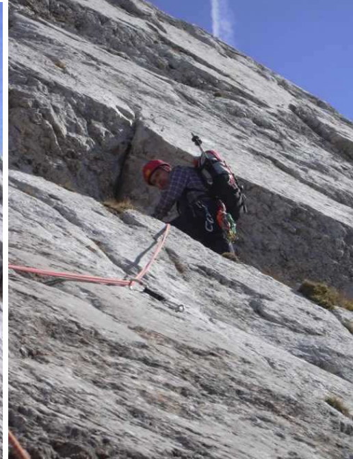
Stand unter Überhang