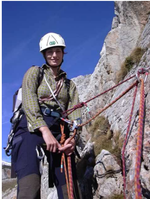
Stand am Plattenrand