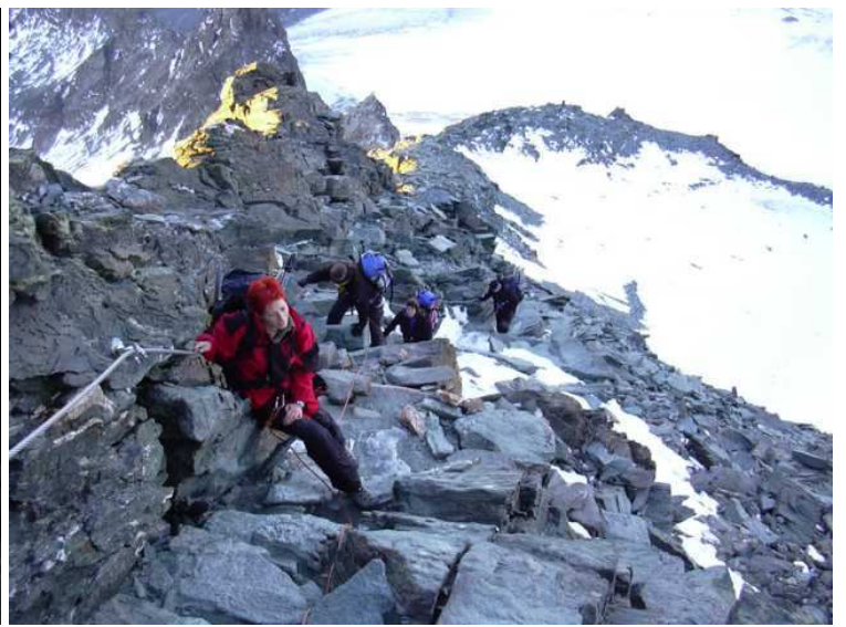
kurz vor der Adlersruhe