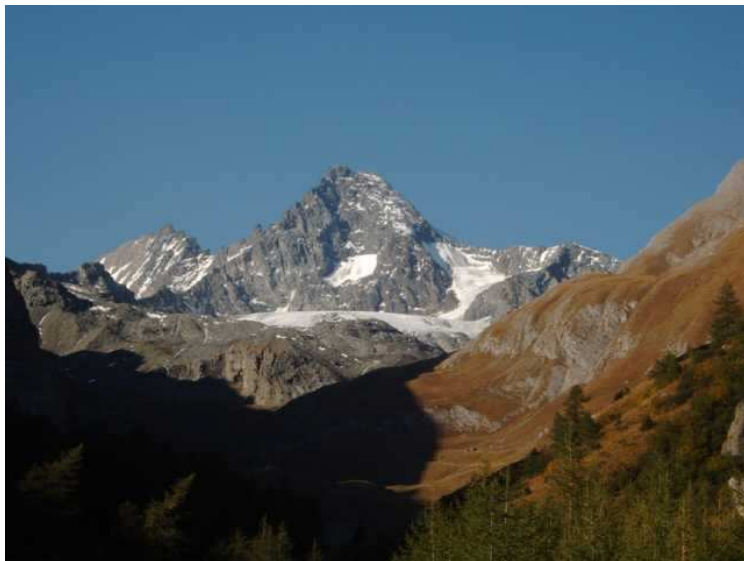
Glockner von Süden im Herbst 2003