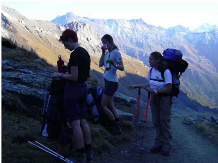
Unsere Damen (zahlenmäßig überlegen ☺) bei einem Pauschen