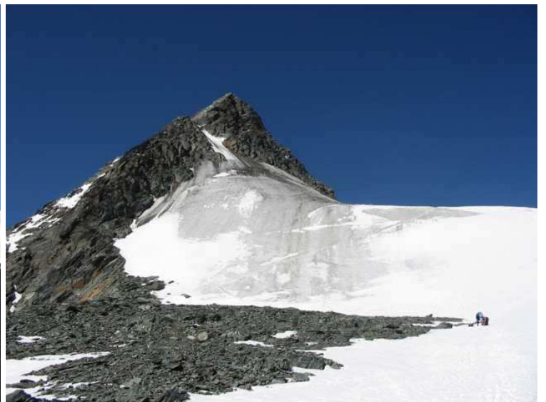
Glocknerleit im Herbst 2003