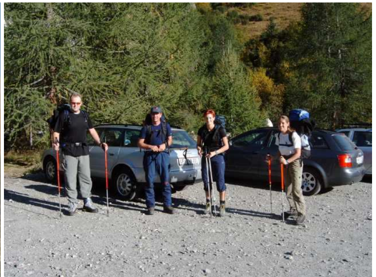
Abmarsch beim Lucknerhaus