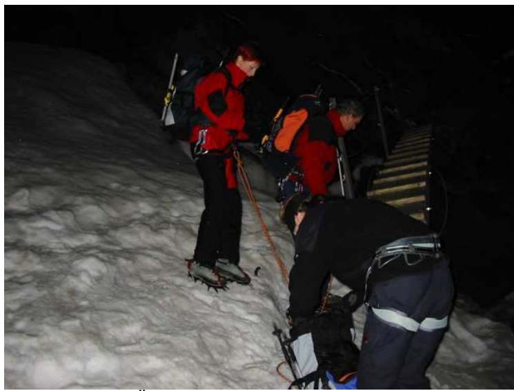
Übergang zum Kampl