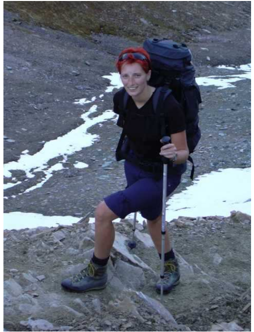
-----Beim Zustieg zur Stüdlhütte-----