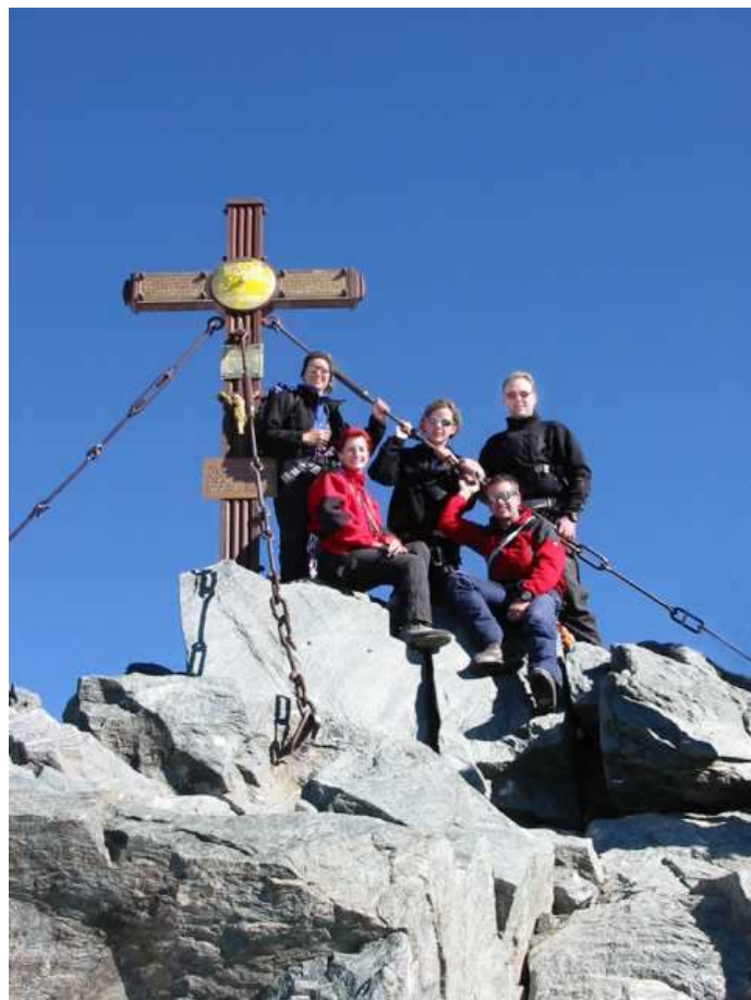
Mit Freunden am Großglockner