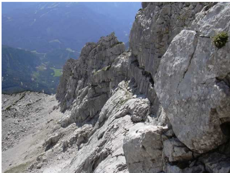
In Bildmitte sieht man die lange Querung