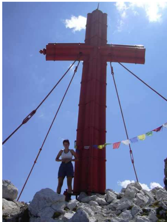
Ebsi am Großen Priel

An einem der heißesten Tage dieses Sommers packten wir wieder unseren Rucksack und fuhren nach Hinterstoder. Nach langem Hartsch in das Tal Richtung Talstation der Materialseilbahn ging es auf relativ steilem Wanderweg zum Prielschutzhaus. Dort labten wir uns gleich einmal um nach 30 Min. zum Einstieg des Klettersteiges auf zu rechnen. Der Steig beginnt gleich mit ein paar knackigen Metern und hält bis zur Mündung auf den Südgrat was er unten verspricht. Tolles alpines Ambiente und zum Teil sehr ausgesetzte Passagen machen diesen Klettersteig zum ganz großen Erlebnis. Abgestiegen sind wir über den Normalweg durch's Kühkar. Wir machten ca. 2000 Hm an diesem Tag im Auf- und Abstieg. Weit komfortabler wäre die Tour mit einer Übernachtung im schönen Prielschutzhaus. Wandhöhe: 660m, C-D, unsere Kletterzeit: 2:35 Team: Ebsi und Peter Karte: ÖK, Blatt 97+98, Info: Klettersteige und leichter Fels, Schall Verlag