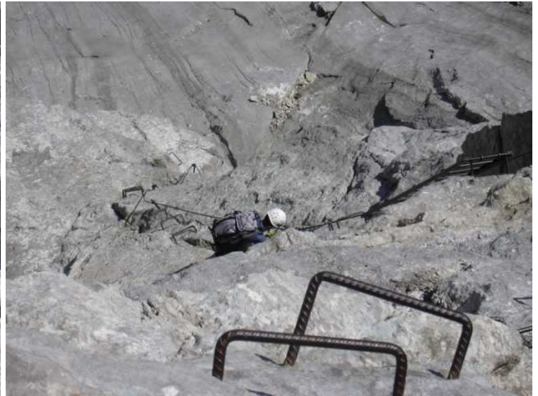
Evelyn im Abschnitt nach den steilen Leitern