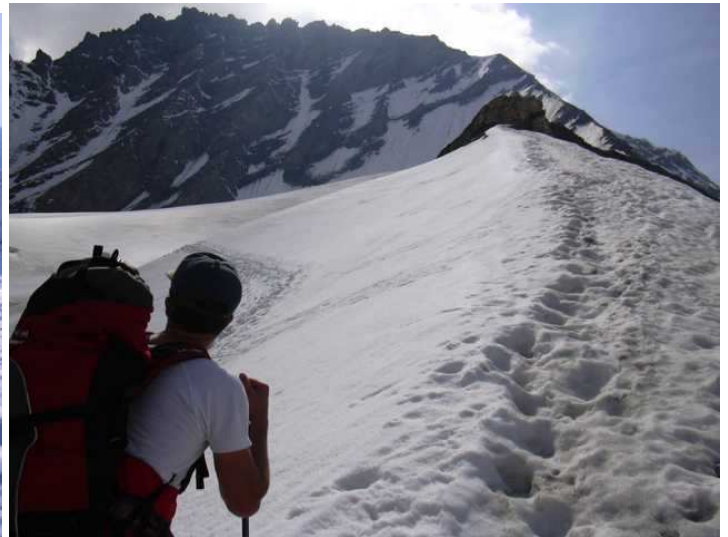
die Schachtel steht auf dem kleinen Felsen rechts