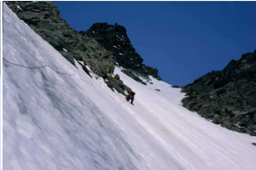
oben wird es etwas besser