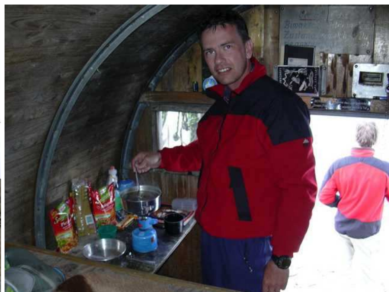
ich bin immer der Koch