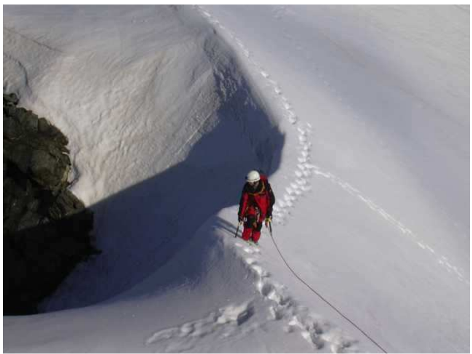
Auf der Grögerschneide