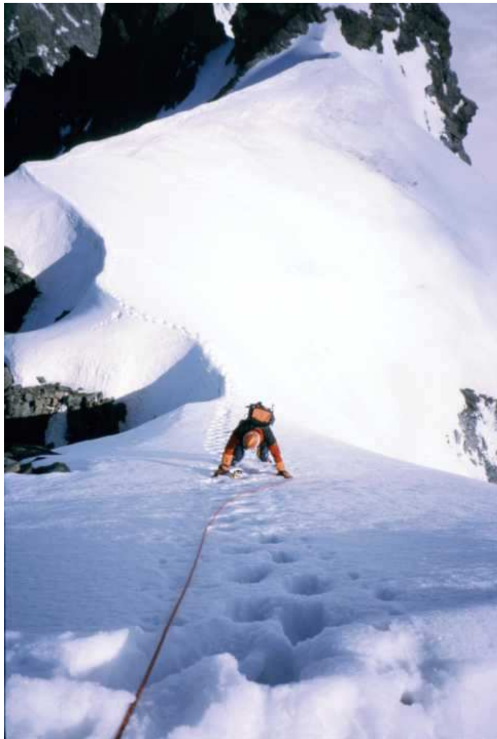
Kurz nach der Grögerschneide