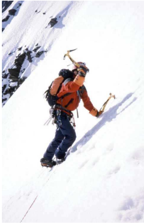
Nahe am Ausstieg