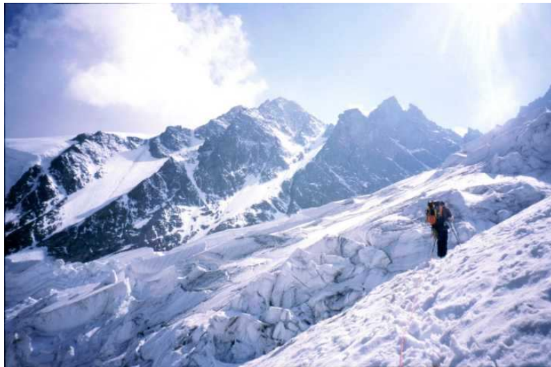
Zustieg zum Biwak