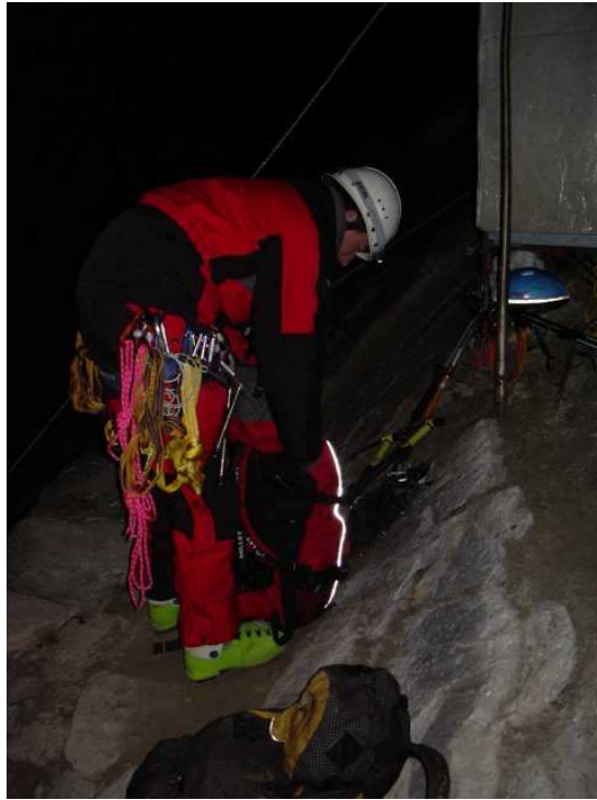
Zusammenpacken um 3:30