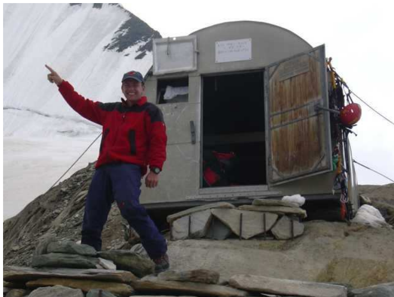
In die Richtung müssen wir morgen..... ☺