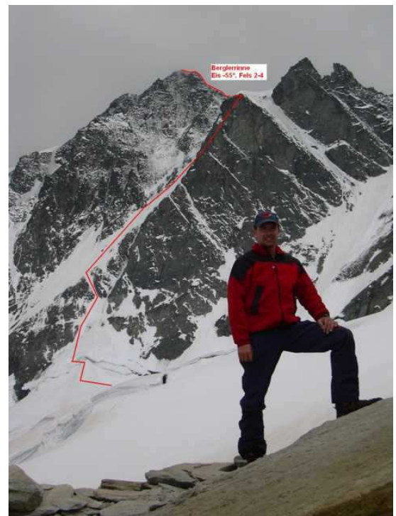
Blick vom Biwak in die Wand

Karte: ÖK, Blatt 153, Info: Firn- und Eisklettern in den Ostalpen, Alpinverlag Jentsch-Rabl