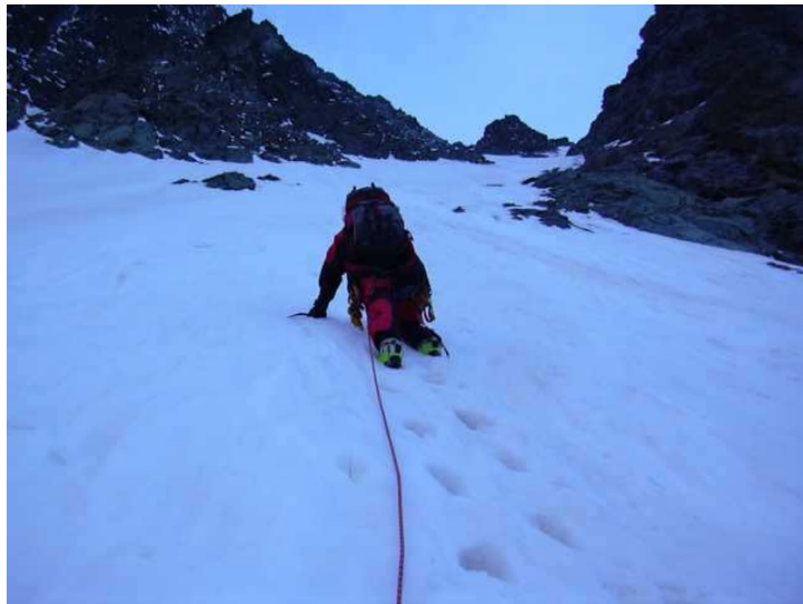
Unten tiefer Sulz