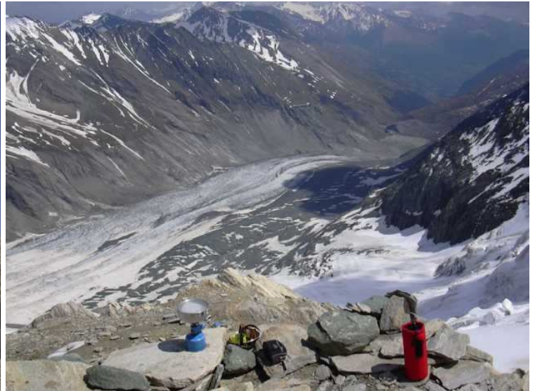
vorerst konnten wir aber noch gemütlich kochen