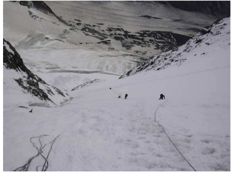
Blick runter in die Palla