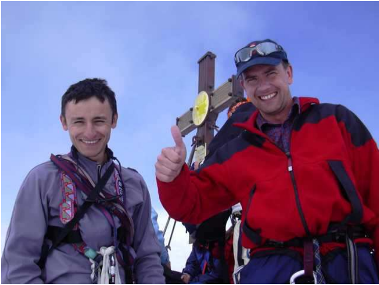
am Gipfel war die Freude aber trotzdem groß