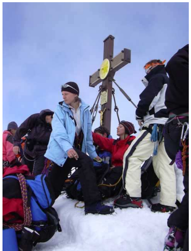
Hochsaison am Glocknergipfel

Karte: ÖK, Blatt 153, Info: Firn- und Eisklettern in den Ostalpen, Alpinverlag Jentsch-Rabl