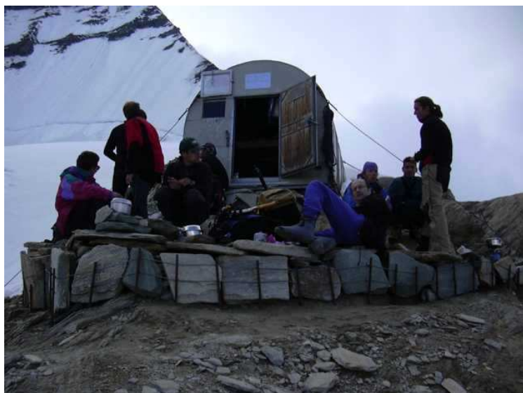
Es wird schon voller