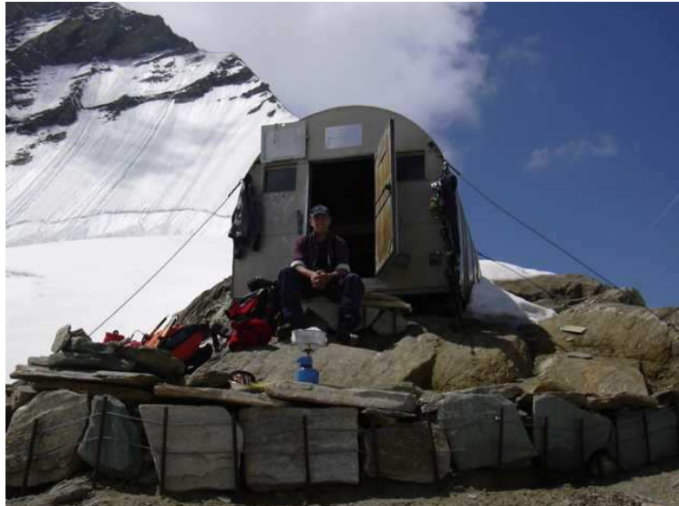
In der kleinen Schachtel sollten dann noch 22 Pers. Rein